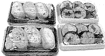
▲地元スーパーでしか手に入らない「お漬物五色いなり」と「お漬物五色のり巻き」…まだまだあります!